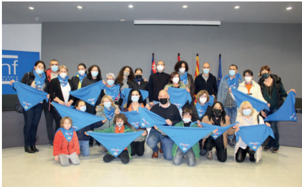
Reconocimiento a los voluntarios que trabajaron en la campaña humanitaria por el pueblo ucraniano.

El Ayuntamiento homenajeó a las personas que colaboraron con su trabajo en la campaña de recogida de ayuda humanitaria, entregándoles una pañoleta solidaria