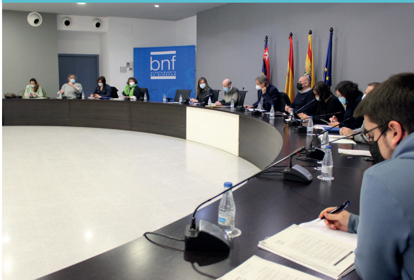
⤴ Sesión plenaria de marzo, donde se aprobaron las modificaciones de crédito.

La mejora del CDM Los Olmos, cuyo proyecto se acomete en su totalidad en el actual ejercicio, queda dotada con 1,8 millones de euros