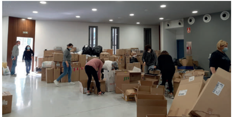
Jornadas maratonianas para recoger los donativos de los binefarenses. El material se embolsó en palés para su transporte hasta Ucrania.

Una treintena de voluntarios, que colaboraron en la recogida de ayuda humanitaria para los ucranianos en los primeros momentos de la invasión que está sufriendo su país por parte de Rusia, fueron homenajeados el pasado 30 de marzo por el Ayuntamiento de Binéfar con la entrega de la pañoleta con los colores binefarenses a los que se añadió la bandera ucraniana.