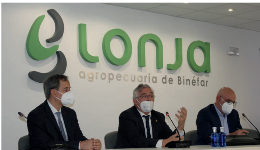
Acto celebrado en la Lonja de Binéfar.