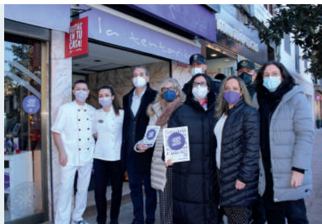
Los puntos violeta se pueden ver en comercios y establecimientos de hostelería.

operativo suscrito entre la Comandancia de la Guardia Civil de Huesca y el Ayuntamiento de Binéfar para garantizar el cumplimiento de las medidas judiciales de protección a las víctimas de violencia de género. Antes, el consistorio binefarense se adhirió al protocolo de la Federación de Municipios y Provincias de España (FEMP).